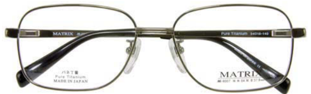
IP GR (IPグレー)