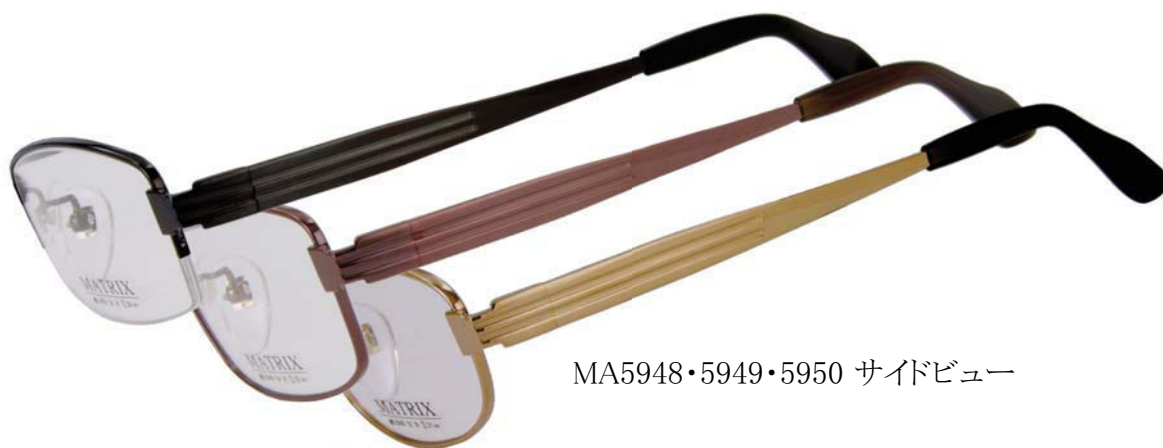
MA5948・5949・5950 サイドビュー