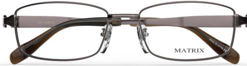
IP BR (IPブラウン)

52□17-140 (♠31.0) 54□17-140 (♠32.2) 56□17-140 (♠33.4)