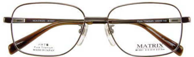
IP BR (IPブラウン)