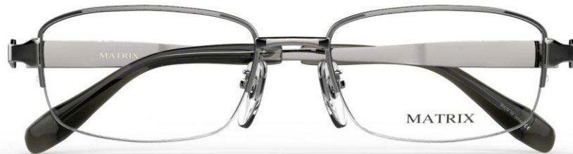
IP GR (IPグレー)