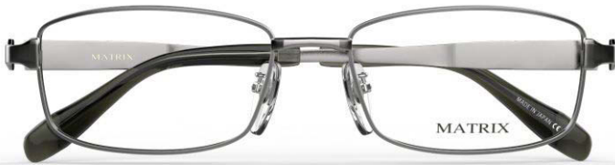
IP GR (IPグレー)

52□17-140 (♠31.0) 54□17-140 (♠32.2) 56□17-140 (♠33.4)